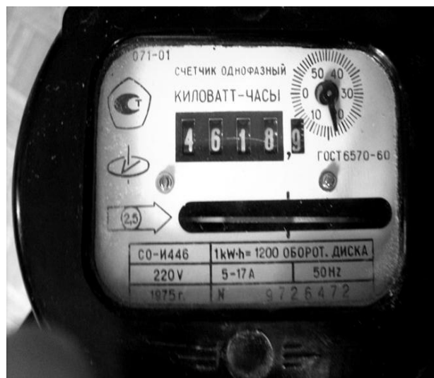
Рис. 6. Счетчики учета электроэнергии