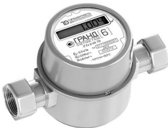
Рис. 5. Счетчики газа