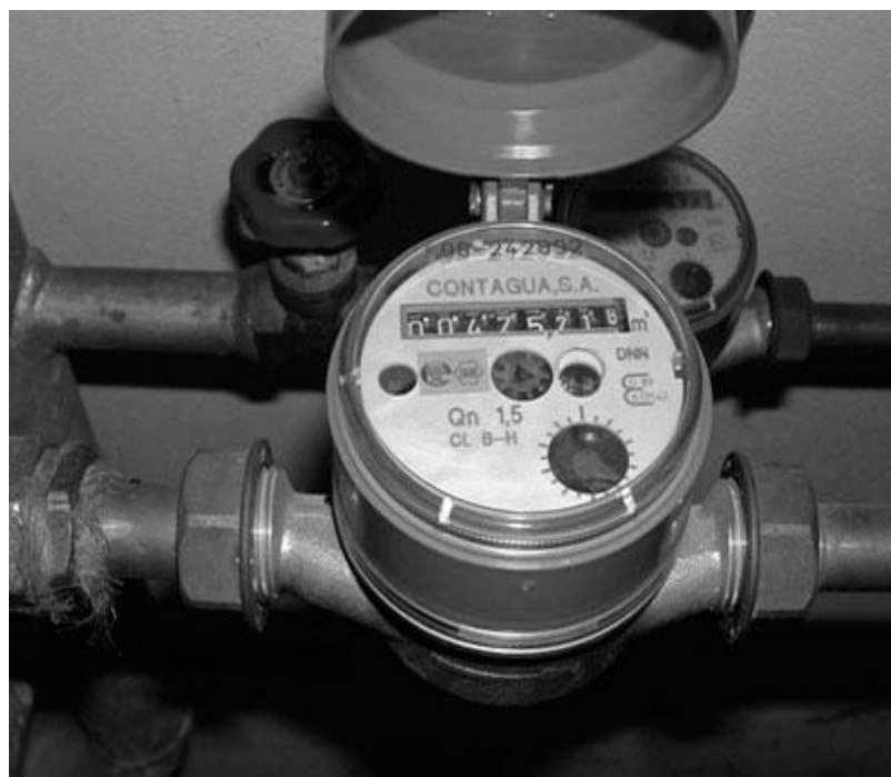
Рис. 2. Счетчик холодного водоснабжения