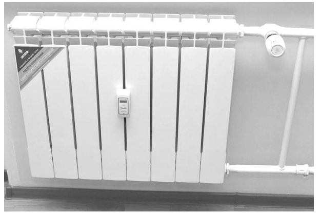
Рис. 8. Счетчики тепла